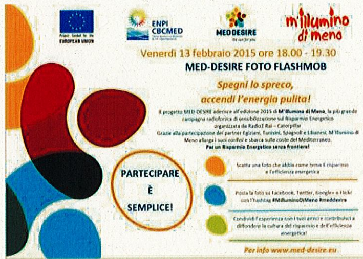
Foto-Flashmob Internazionale per M'illumino di meno con i partner del progetto MED DESIRE

Venerdì 13 febbraio dalle 18.00 alle 19.30 il progetto strategico MED-DESIRE organizza un foto-flashmob internazionale per sensibilizzare al risparmio energetico utilizzando la pervasività dei social network: si tratta di una sorta di contest fotografico promosso e organizzato attraverso gli account social del progetto (Facebook, Twitter, Google+ e Flickr) e dei 9 partner, coinvolgendo pertanto le 5 nazioni d'appartenenza, cioè Italia, Spagna, Tunisia, Libano ed Egitto.